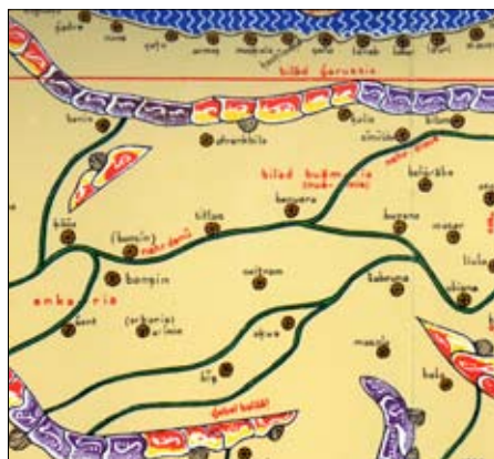
Idrisi 1154-es világtérképének részlete, közepén „títilus” helynévvel a Duna mentén