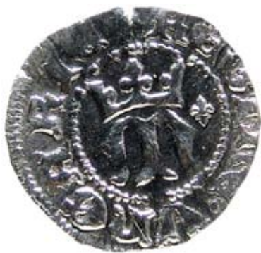
Mária királynő (1382–1387) ezüst dénára, elő- és hátlap