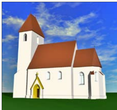
A Tételhegyen foltárt templom késő gótikus állapota. Rekonstrukció: Buzás Gergely, MNM Mátyás Király Múzeum

ga, mint a férfiaké. Ez a terhességi szövődmények, a szülések és a vetélések mortalitási (halandósági) kockázatával jól magyarázható. A nők halandósági maximuma a 30–34 éves korcsoportban volt, ekkor halt meg a felnőtt nők több mint egynegyede (további ötöde 35–39 éves korban). A férfiak halálozása az adultusz (középkorú felnőtt) korcsoportban szintén magas. Ez elég sokatlan, főként ha figyelembe vesszük, hogy kevés a harci cselekményekre utaló csontsérülés. Az adultusz korcso-